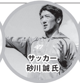
元コンサドーレ札幌 MF。1996年に柏レイソルに入団、プロとしてのキャリアを開始し、2003年にコンサドーレ札幌に期限付き移籍(05年完全移籍)。以来12年半もの長きにわたりコンサドーレ札幌に所属し、チームを牽引してきた。