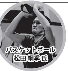
礼文町出身。日本大学を卒業後、北海道文化放送(UHB)入社。報道記者として活躍するかたわら、バスケットボールを続け現在に至る。アメリカプロバスケットボール独立リーグ所属現役選手。