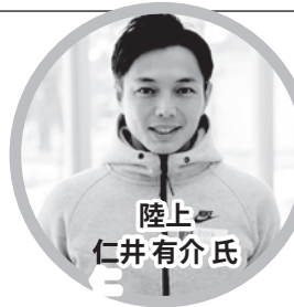
元ハイテク AC 所属 100m 選手。実業団優勝経験者。伊達市出身。小学生からプロアスリートまで幅広く指導を行っている。

教育力の向上、スポーツの活性化、アスリートのセカンドキャリア創出、企業ブランディングへの活用、子どもへの平等な成長機会を提供、なにより一人でも多くの方がスポーツを楽しめるように。ここ北海道から、新たなスポーツビジネスの在り方を発信していきます。